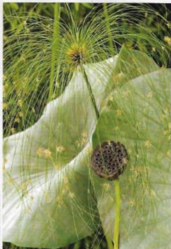
Contraste de feuillages. Le fin feuillage du papyrus, souple et longiligne, réuni en ombelle en haut des tiges, se marie parfaitement à celui aux nuances bleutées du lotus.