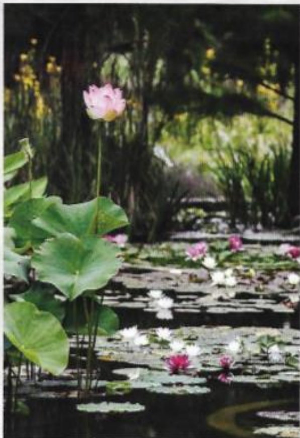
Compagnons naturels. Les nénuphars se développent à la surface de l'eau et forment des masses circulaires fleuries, servant d'écrin à l'opulente végétation aérienne des lotus.