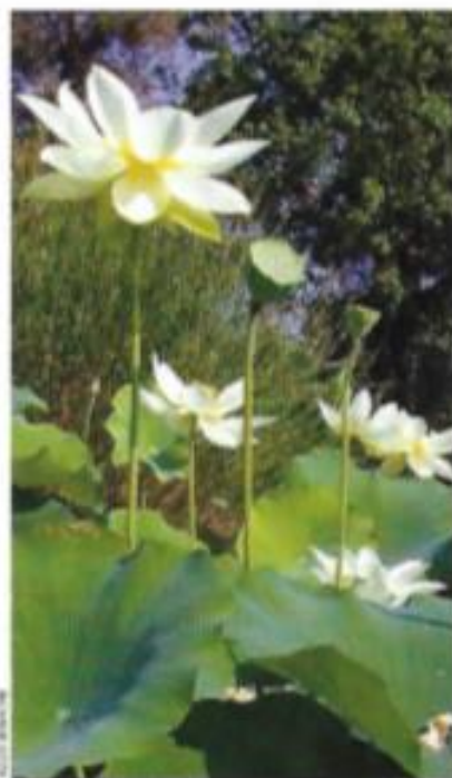
De larges corolles, très élégantes, d'un jaune très pâle presque blanc, se déploient amplement au-dessus des imposantes feuilles. 'The Queen' porte bien son nom de digne représentante des grands lotus.