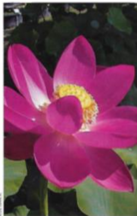
Aussi connu sous le nom de "lotus rouge", N. pekinensis 'Rubra' est le premier hybride chinois introduit en Europe. Ses grandes fleurs simples (25 cm) sont à la mesure de sa végétation très généreuse (H. 1,80 m).