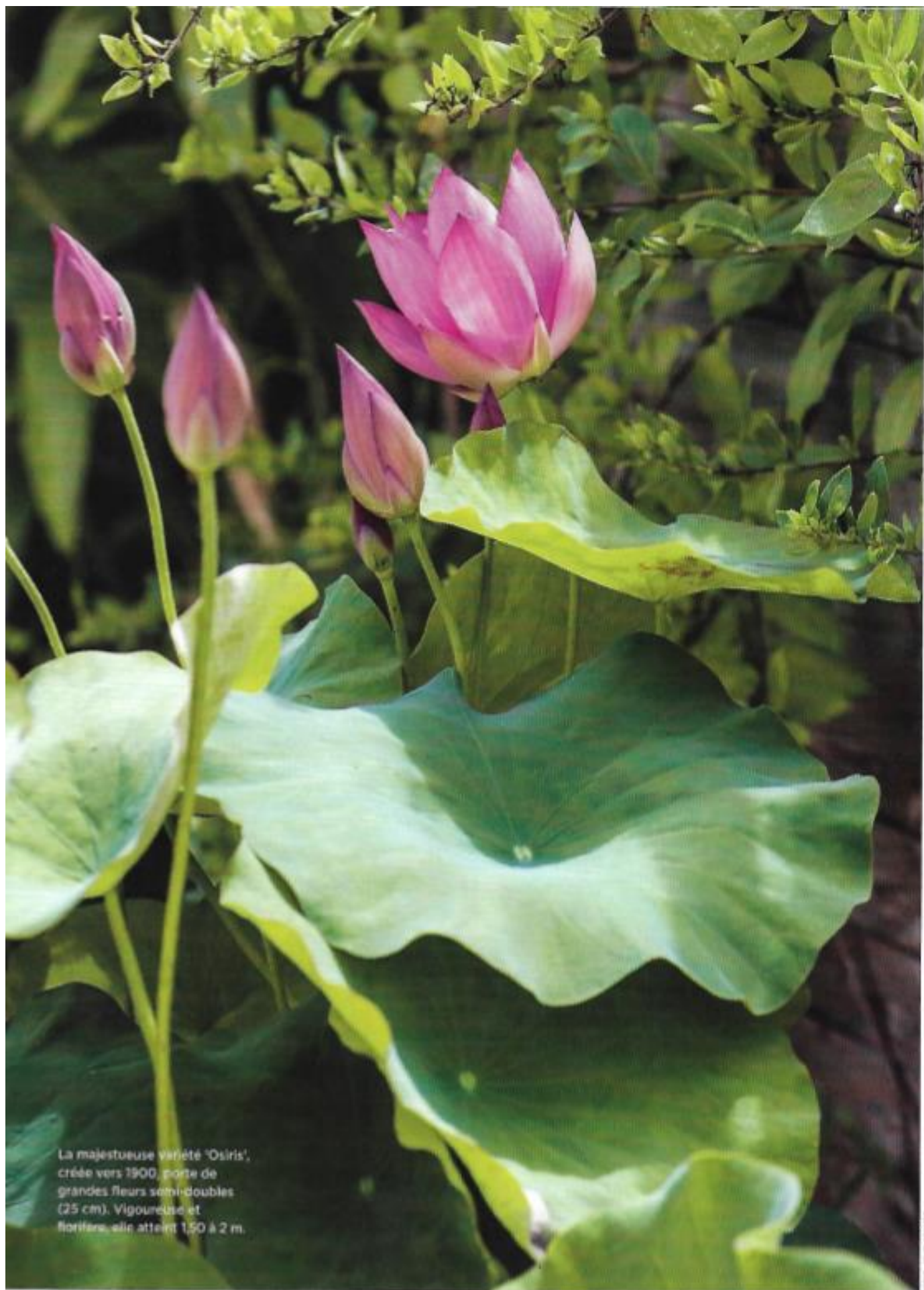
La majestueuse variété 'Osiris', créée vers 1900, porte de grandes fleurs semi-doubles (25 cm), vigoureuse et florifère, elle atteint 1,50 à 2 m.