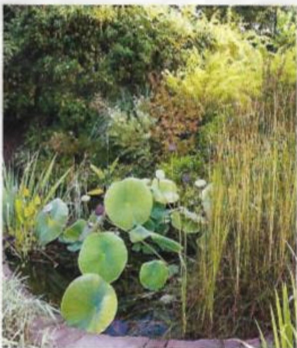
Scène d'automne. La floraison des lotus est achevée, faux fruits et feuillage persistent accompagnés de massettes ( Typha ) et des feuilles étroites des iris d'eau, commençant à jaunir.